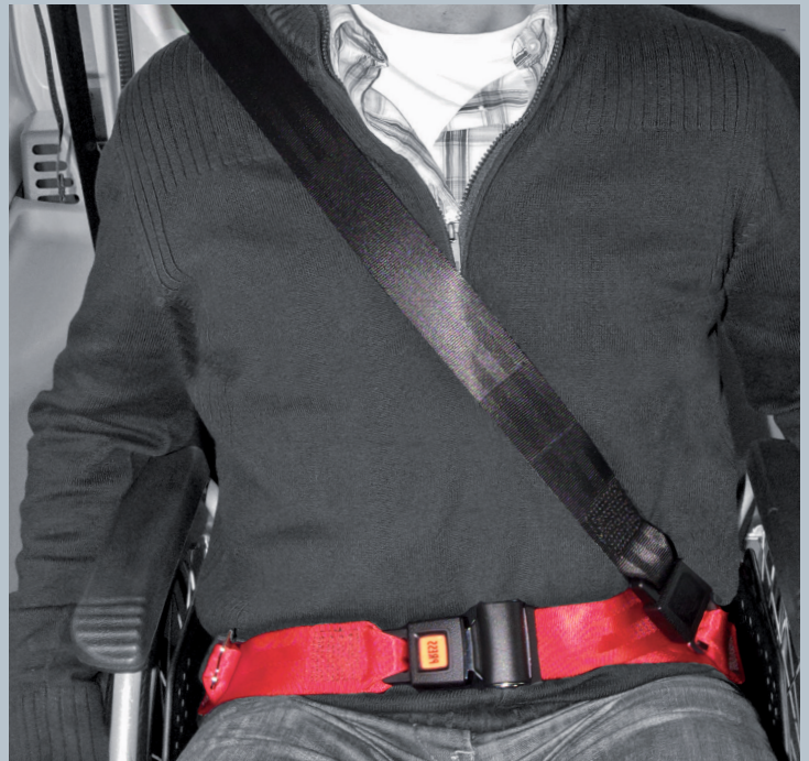
Der Beckengurt (rot) ist fester Bestandteil des Kraftknotens. Der Schultersträggurt (schwarz) ist im KMP/Kfz montiert.

Der vorliegende AMF-Bruns Kraftknotenadapter ist in Anlehnung an DIN 75078-2 / ISO 10542 getestet. Der Rollstuhltest nach ISO 7176-19 obliegt dem Rollstuhlhersteller.